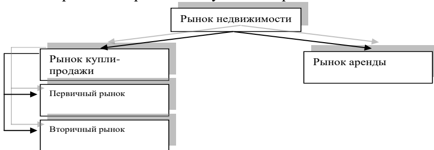
Рис. 2 Классификация рынка недвижимости от вида сделки

Еще одна распространенная классификация в зависимости от вида сделки. Данную классификацию целесообразно изобразить следующим образом: